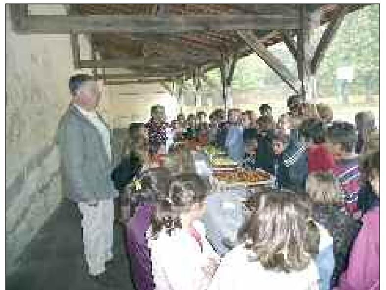
Sous le préau

Cette opération nationale a été l'occasion pour les élèves de l'école primaire de découvrir différentes saveurs : salé, sucré, acide, amer, ainsi que les cinq sens.