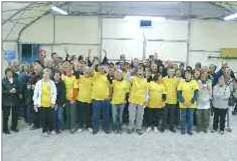
De nombreux bénévoles pour fermer la Ronde