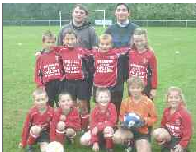
L'équipe des U9

Samedi 16 octobre, les U9 reçoivent les clubs de Sarlat, de Terrasson, de l'Élan salignacois, de La Ménaurie et de l'US Campagnac/Daglan/Saint-Laurent foot sur le terrain de Saint-Julien-de-Lampon.