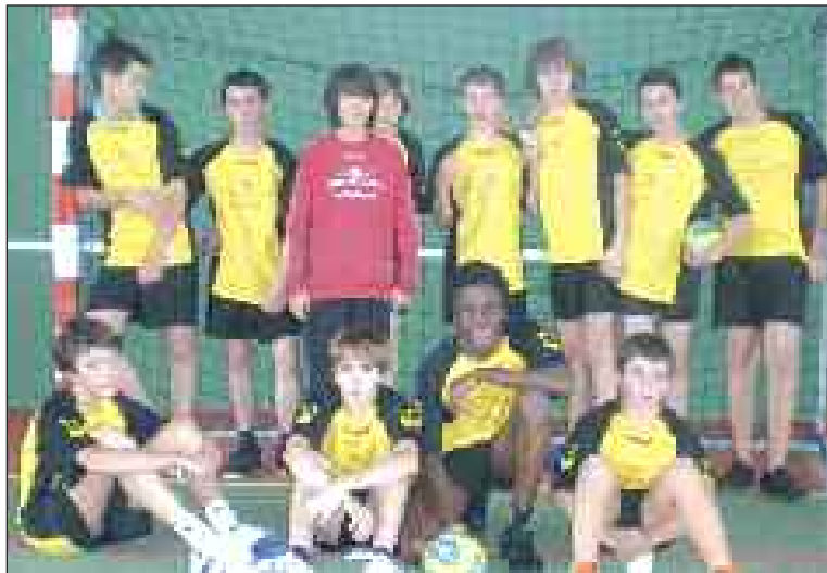
Triste mine pour la jeune équipe des moins de 15 ans

Samedi 16 octobre, les moins de 11 ans rencontraient Cèpe Vert 1 à Coulaures.