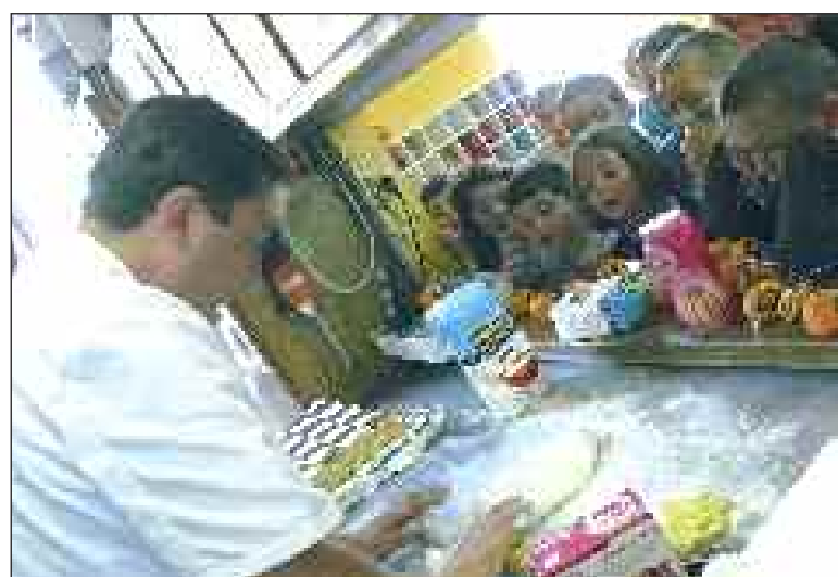
Les enfants attentifs aux gestes du cuisinier