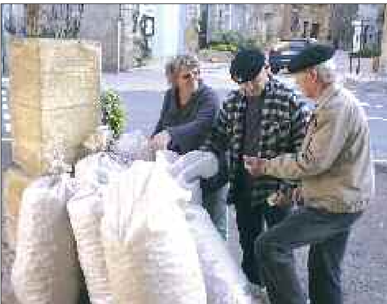
Chacun vante son produit